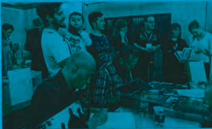
Une trentaine d'auteurs de polars, y compris scénaristes et illustrateurs de bandes dessinées, se sont prêtés au jeu de la séance de dédicace, hier, au Musée historique de Mulhouse, pour le 4 e Festival sans nom.