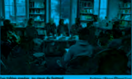
Les tables rondes, au cœur du festival.